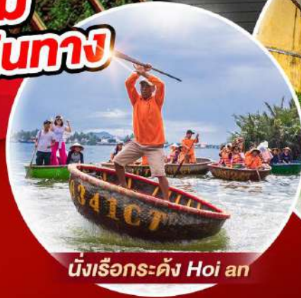
นั่งเรือกระด้ง Hoi An